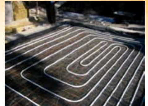
Mise en place de l'échangeur de chaleur.

des principes bioclimatiques, d'efficacité énergétique et d'intégration de l'énergie solaire. L'éco-conception offre un double avantage. Du point de vue économique, d'abord, l'approche mène à d'énormes gains énergétiques et nous pouvons diviser par deux la consommation d'un