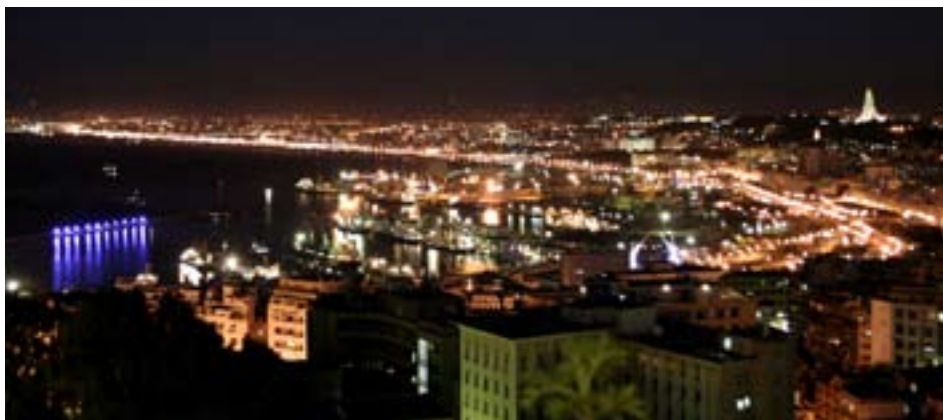
L'Algérie à l'ère de grandes mutations économiques et sociales face aux grands défis énergétiques de demain.

Donc, la promotion de produits énergétiquement efficaces répond aux attentes des initiateurs du PNME, lancé en 2007, et épouse les contraintes qui s'imposent de plus en plus à de nombreux pays, dont l'Algérie qui, comme nombre de pays, doit intégrer dans sa stratégie de développement la dimension économie. La rationalisation, la maîtrise de l'énergie, la protection et la préservation de l'environnement, entre autres la rationalisation de l'utilisation de l'énergie passent donc par la protection des ressources énergétiques et en sont une exigence comme le sont les changements dans les habitudes de consommation, l'adoption d'équipements labellisés... en définitive le développement d'une culture de la maîtrise de l'énergie et l'émer-