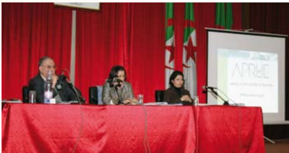
Journée d'étude (12 e BATIMATEC)

Il a été démontré que l'Algérie n'est pas en reste de ce schéma exposé puisqu'elle est, à l'instar d'autres pays, touchée par les conséquences du phénomène des changements climatiques. Les inondations survenues durant la dernière décennie en témoignent fortement : l'exemple de Bab El Oued à Alger, en 2001, et de Ghardaïa, en 2008, sont des plus marquants. Pourtant, l'évolution de la consommation énergétique, notamment dans le secteur résidentiel représentant 35% de la consommation énergétique finale nationale, demeure exponentielle. En effet, les bâtiments d'habitation produits présentent des architectures non adaptées aux climats recourant ainsi excessivement aux systèmes de chauffage et de climatisa-