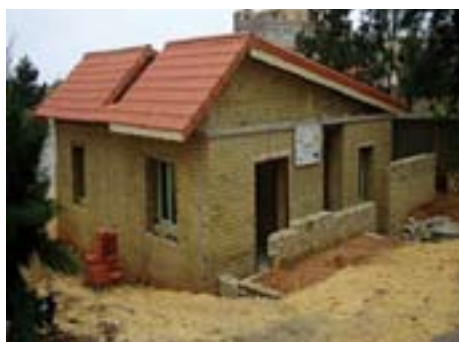
Projet pilote : Logement efficace en énergie

L'étude énergétique préliminaire a fait ressortir des économies d'énergie de l'ordre de 60% en faveur du projet pilote comparé à une habitation classique. Sur le plan environnemental, les économies d'énergie engendrées par ce projet pilote correspondent à une réduction des rejets de CO 2 d'environ 5 000 kg/an ●